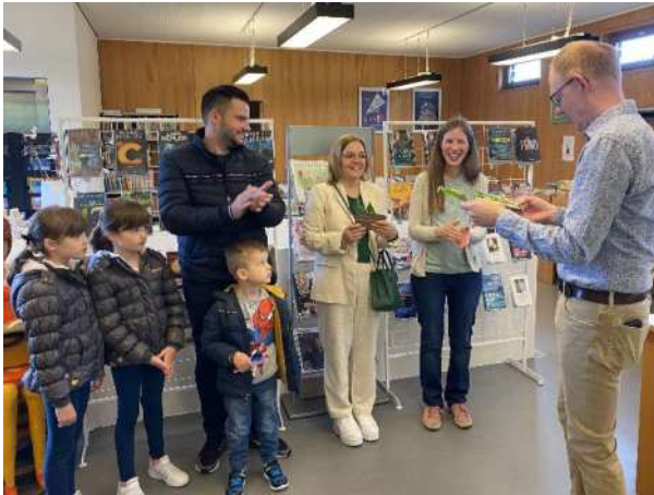
6. Mai: Tag der offenen Tür mit Neuerscheinungen Die fleissigsten Migros-Punkte-Sammler erhalten eine kleine Anerkennung (Migros-Gutschein)