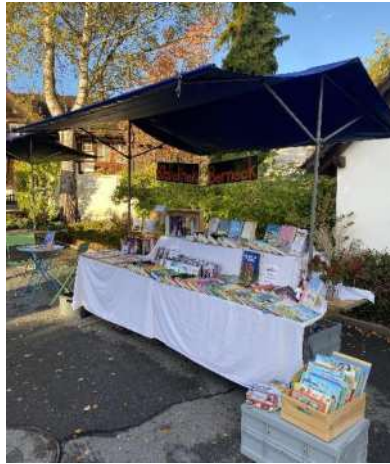
28. Oktober: Jahrmarkt «Schreib mit uns ein Buch ....»

Schön präsentiert sich unser Stand bei herrlichem Herbstwetter