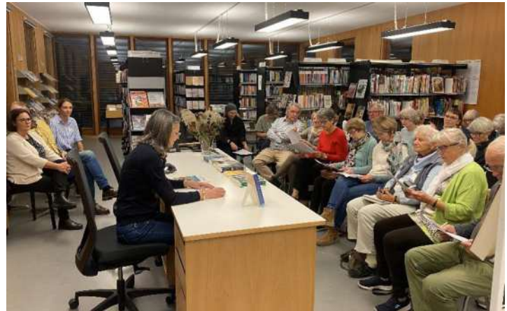
2. November: Sehr gut besuchter Bücherherbst Das Team stellt Neuerscheinungen vor

Schön präsentiert sich unser Stand bei herrlichem Herbstwetter