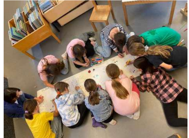
24. Mai: Schweizer Vorlesetag: Mitraterkrimi für die 3. bis 6. Primarklassen