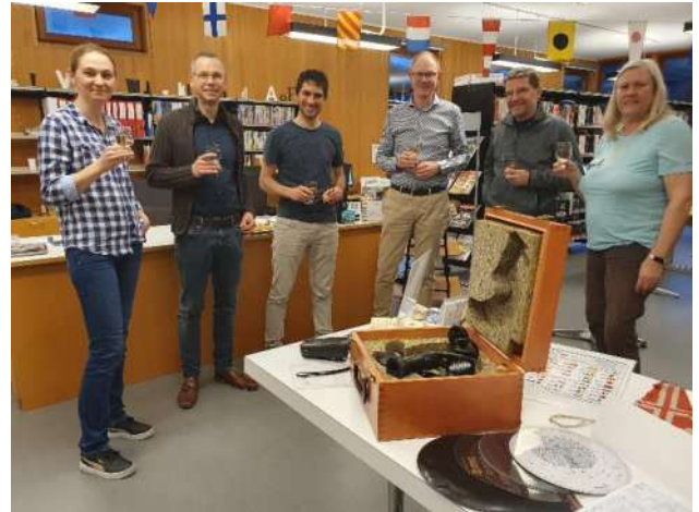
24. März: Biblio-Suisse Weekend „Segel setzen“ Spannende Ausstellung zum Thema Segeln u. Meer Vorne: Sextant, Logbücher, Karten, Flaggen usw.