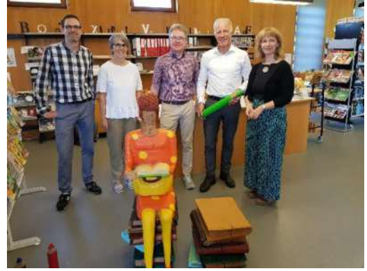
8. Sept.: Die kant. Bibliothekskommission besucht unsere Bibliothek