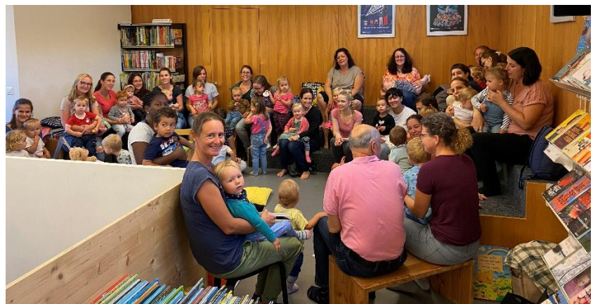
18. Mai: Schweizer Vorlesefest, Buchstart und Lesemaus Die Bibliothek platzt aus allen Nähten ...!