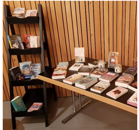
2. November: „Bücherherbst“ – Das Bibliotheksteam stellt Neuerscheinungen im Haus des Weins vor. Ein geselliger, gemütlicher Abend bei Risotto und Wein beschliesst das Jahr 2022.