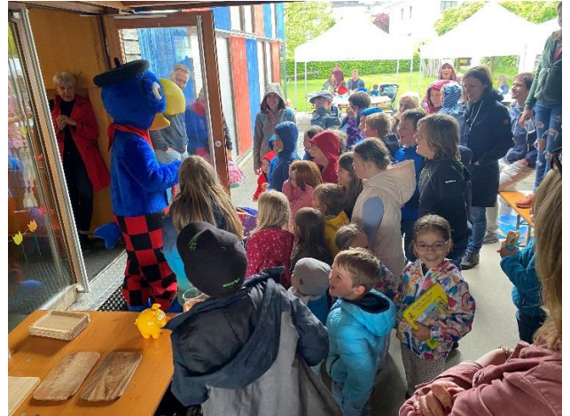
7. Mai: Tag der offenen Tür: Globi kommt zu Besuch, Autogrammstunde, Festwirtschaft, Glacéstand