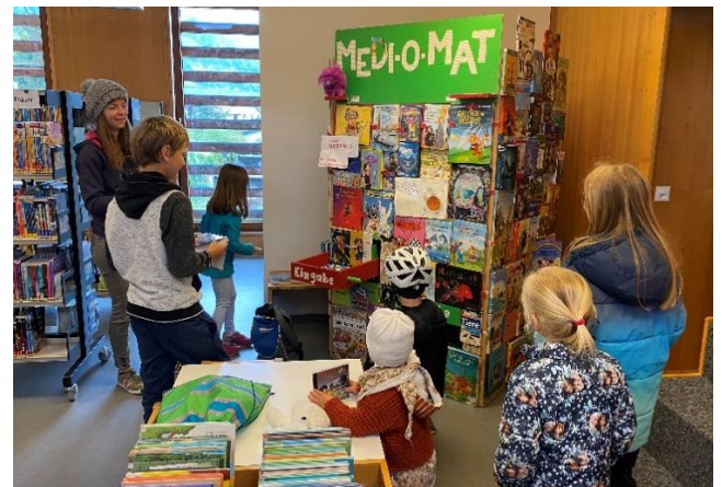
Medi-O-Mat (4x im April / Frühlingsferien) Medien-Tausch-Automat mit Überraschungen