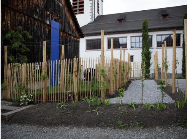
29. April, „Das Paradies findet statt“ an der Neugass 4 (Gestaltung Marianne Hochreutener)