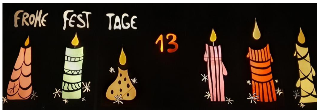
Und so stimmig präsentierte sich unsere Bibliothek zur Eröffnung des Adventsfensters am 13. Dezember 2022.