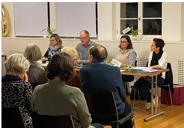
50. HV vom 16. März im kath. Pfarrsaal mit 66 Teilnehmenden