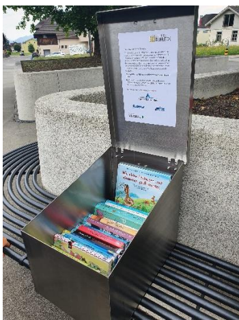
... und beim Alpha-Pärkli sowie am Grüeziweg und oben in der Pfauenhalde werden 3 Bücherboxen auf Ruhebänken montiert.