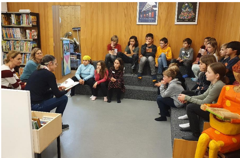
11. November: Schweizer Erzählnacht unter dem Motto „Verwandlung“