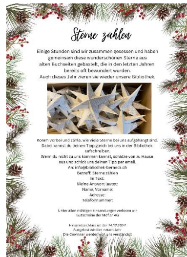
Dezember: Digitaler Adventskalender mit Wettbewerb