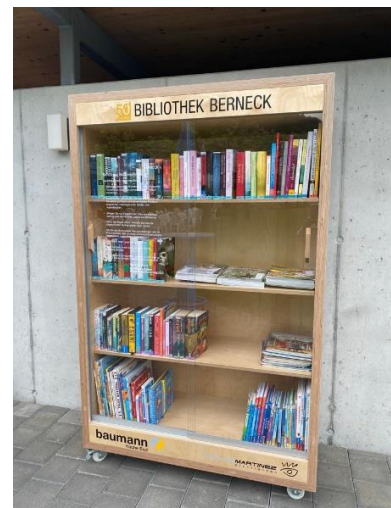
14. Mai: Die Badi erhält einen prächtigen Bücherschrank ...