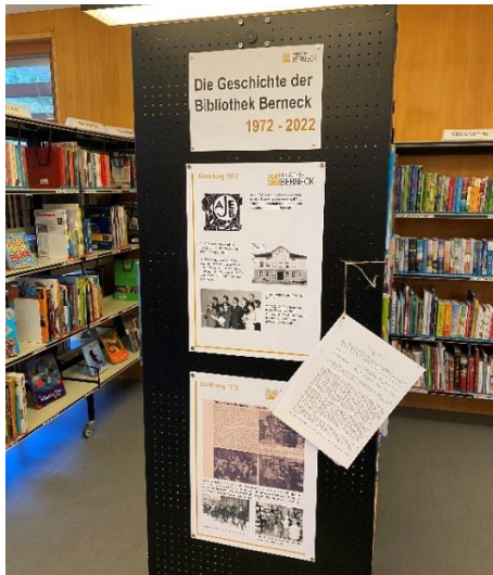
Ausstellung Februar bis März in der Bibliothek, 12 Tafeln