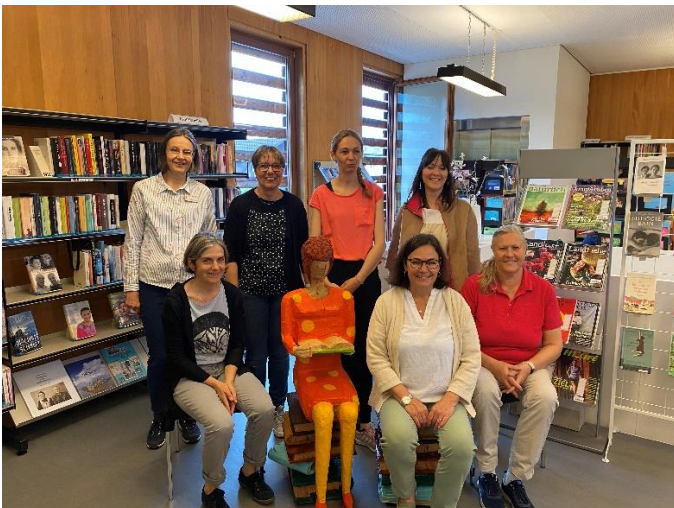
7. Mai: Willkommen LISA inmitten des Ausleihteams! Die schöne Holzfigur wird uns an den Anlässen begleiten.